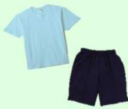
Tシャツ:綿100% ハーフパンツ:綿5%・ ポリエステル95%