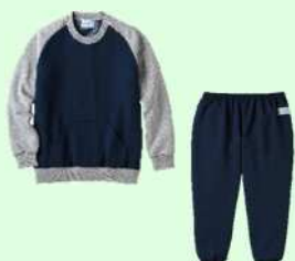
綿10%・ポリエステル90%